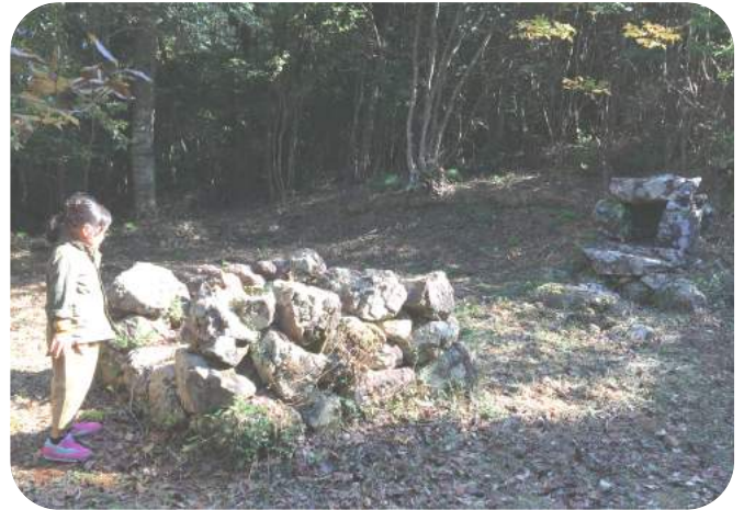
急な崖などの危険な箇所もありますが、それらに勝るとくさんの見どころがあります。(画像：大岩の上から加茂を眺めて、バイカオウレン、護摩壇跡)